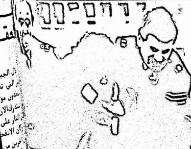
هذه هي الطريقة التي يتعامل بها البوليس البريطاني مع عمال المناجم المضربين !!

اعصابها بسبب استمرار الاضراب وعدم نجاعة اساليبها في قنعه خاصة وان الشتاء القارس اخذ يجبر الرؤوس الحامية في الحكم على اعادة حساباتها . فرغم ادعاء الحكومة بان لديها رصيدا كافيا من الفحم يمكنها من الصمود وانتظارها ان يعود العمال الجياع الى العمل الا ان شيئا من هذا لم يحدث و برى المراقبون ان الوقت يعمل لصالح العمال حيث انه اذا استمر الاضراب فان احتياطي الفحم في محطات الطاقة سيصل الى وضع حرج هذا الشهر والشهر القادم وقد يستهلك كلة قبل عيد الميلاد .