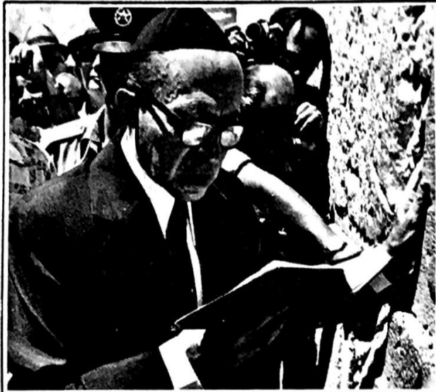
بيغن مع وحدة الارض باي ثمن